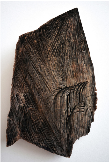
Cécile Hartmann, The Cut , 2020. Bois coupé, pigment noir.

- Comme tu l'indiques, le projet se développe autour de cette métaphore du serpent noir : le pipeline géant Keystone qui transporte quotidiennement plus de 700 000 barils de résidus impurs, depuis les exploitations à ciel ouvert de l'Alberta, en passant par les réserves indiennes, souillant les terres et les réserves d'eau et engendrant des dégâts écologiques sans précédent. Le film, Le Serpent Noir (2021), suit le flux invisible du pipeline et constitue le cœur du projet, depuis lequel se déploient en rhizome photographies, élément sculptural, wall-painting et sérigraphies. La relation à l'économie